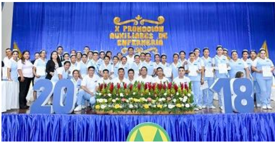
Decima promoción de auxiliares de enfermería

El Recuerdo tiene su propia Escuela privada para la formación de auxiliares de enfermería , autorizada por el MSPAS, con la duración de un año de estudios. Durante 2018 se realizó el mejoramiento de las instalaciones de la Escuela privada de formación de auxiliares de enfermería de la Cooperativa El Recuerdo, ubicada en la sede de la Cooperativa en San Pedro Pinula. Se cambió el techo del salón de clases y se construyó el laboratorio de prácticas para atender a cabalidad las necesidades educativas de los estudiantes. Se formaron 44 auxiliares de enfermería (35 mujeres y 9 hombres) en esta décima promoción.