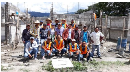
Primera promoción de albañiles