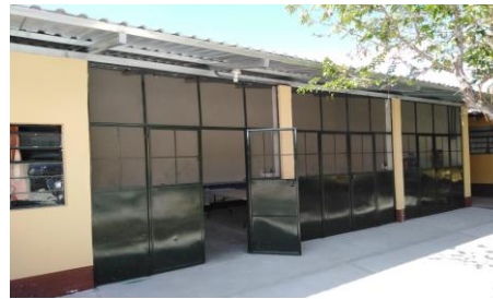
Nuevo laboratorio de prácticas de la escuela

En 2018 se continuó con la imprenta y distribución de los cinco módulos del Programa de formación de Auxiliares de Enfermería y del vademécum de medicamentos, para uso de las escuelas formadoras de enfermería a nivel nacional. Con el cambio del curriculum y de las normas de atención, se inició la revisión del desarrollo temático de los manuales de enfermería.