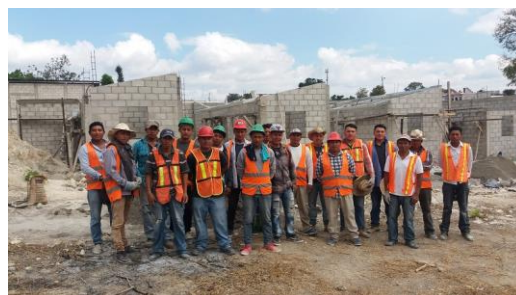
Segunda promoción de albañiles