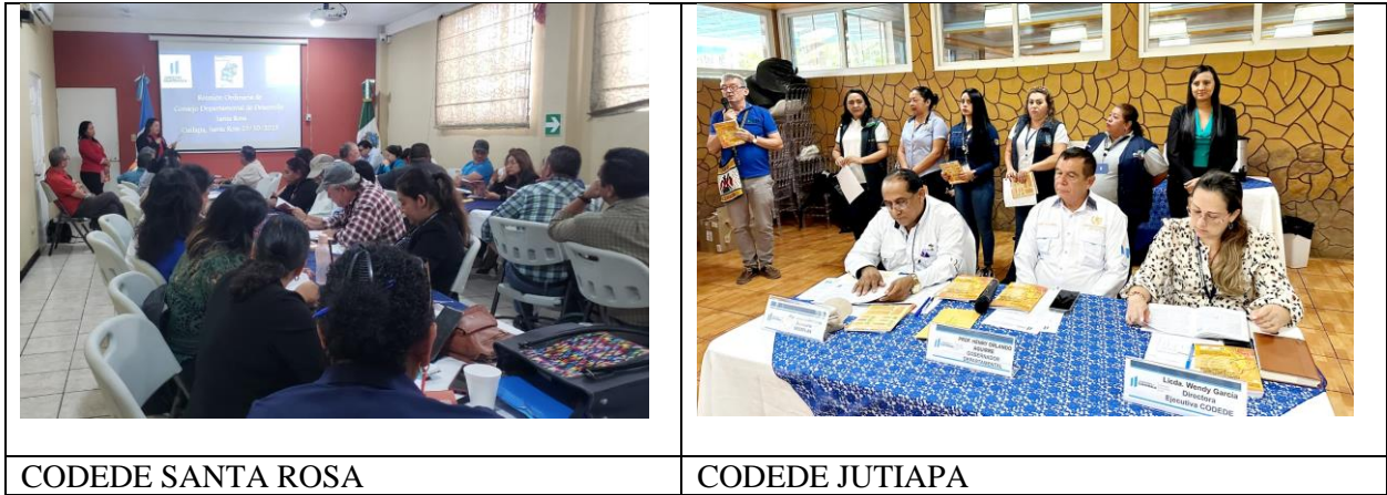
CODEDE SANTA ROSA

En octubre de 2023 fueron aprobados ambas agendas por el Consejo de Desarrollo Departamental de Santa Rosa y Jutiapa